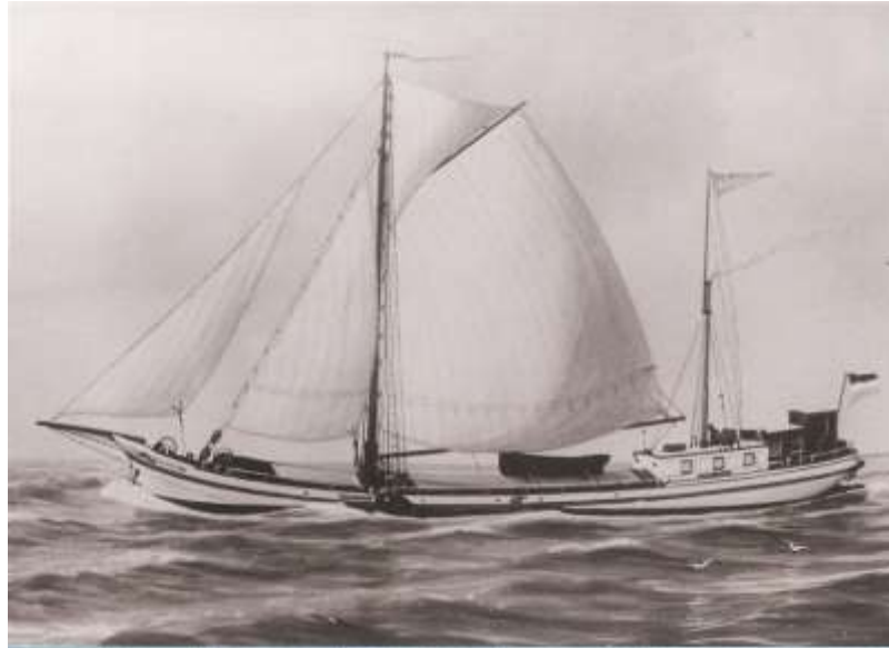
“Azolla”na inbouw van de Hollandia motor in 1927