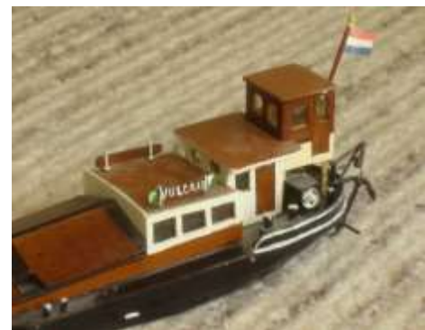
Uitvergroting achterschip “Vulcaan”

doorgegeven aan zijn zoon Finus die heel gedetailleerde scheepsmodellen maakte. De details maakte hij ook allemaal zelf. Zie het uitvergrootte achterschip met anker en ankerdavid.