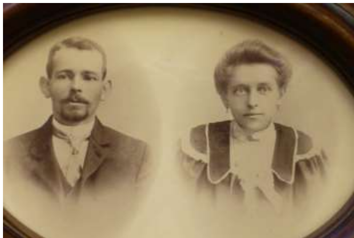
Eerst twee losse foto's; ter herinnering aan de verloving later samengevoegd?