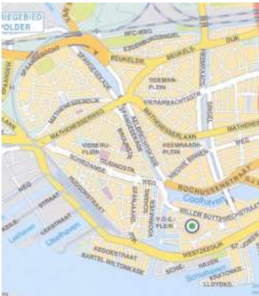
Delfshaven, Schoonderloostraat, vlakbij de Coolhaven. Zie de stip.