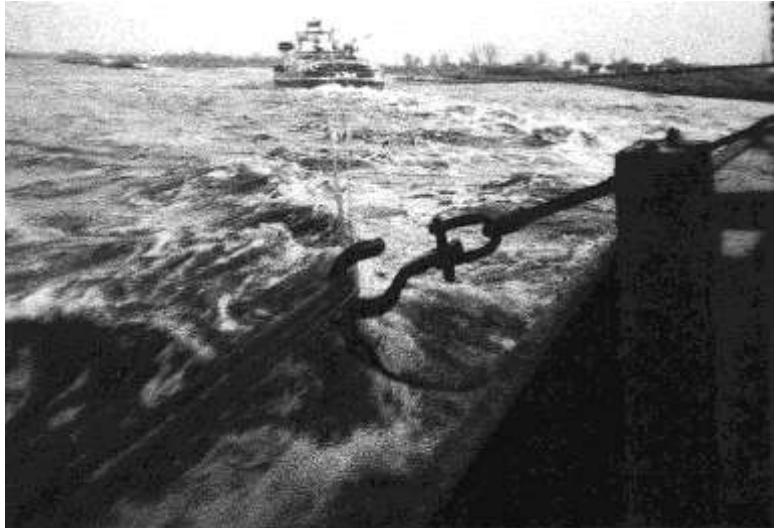
Haak waarmee de strangen (sleepdraden) doorgegeven werden naar de schepen verder naar achteren in de sleep.