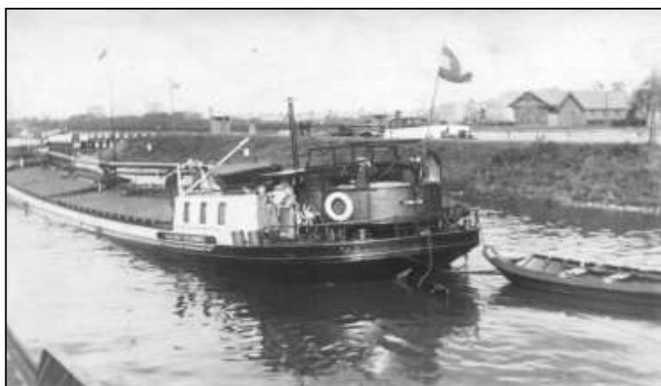
“Variabele”, thuishaven: Halsteren.