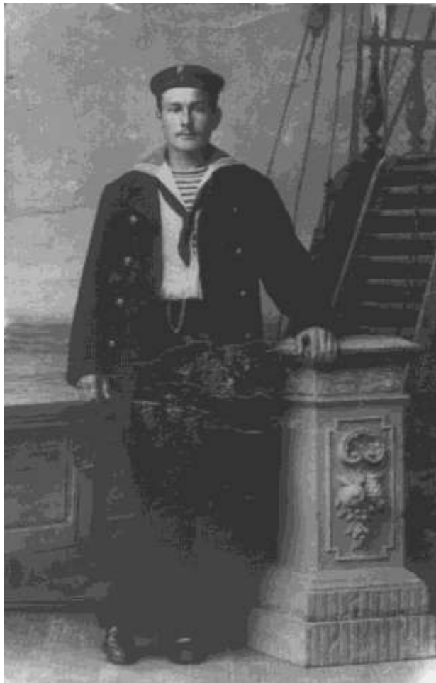
Ben onder dienst