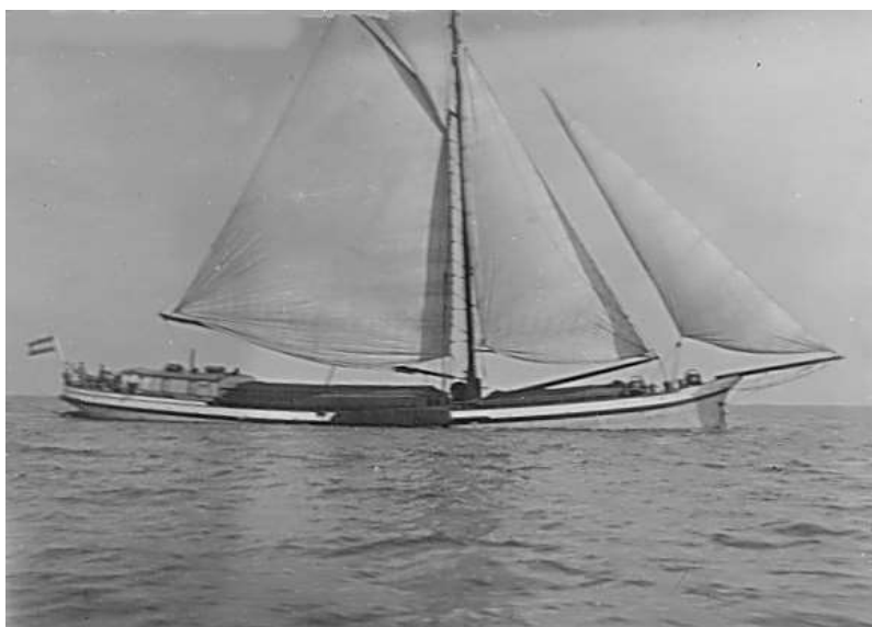
De "Azolla" onder vol zeil; met gaffeltopzeil