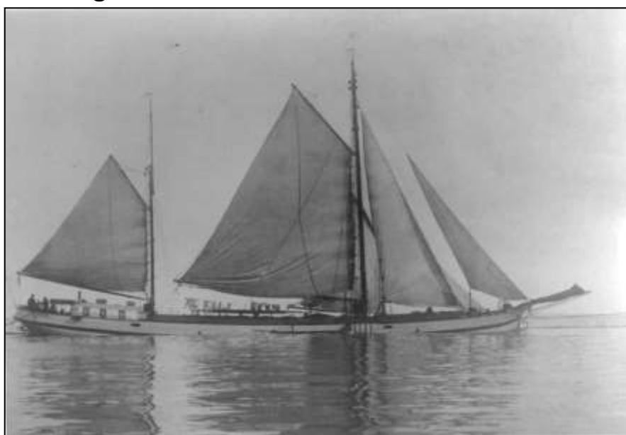
Stalen 2-mast klipper "Progres"