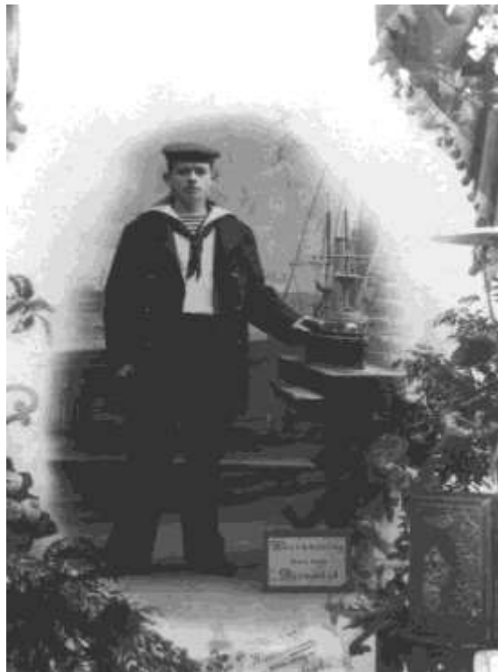
“Herinnering aan mijn Diensttijd”