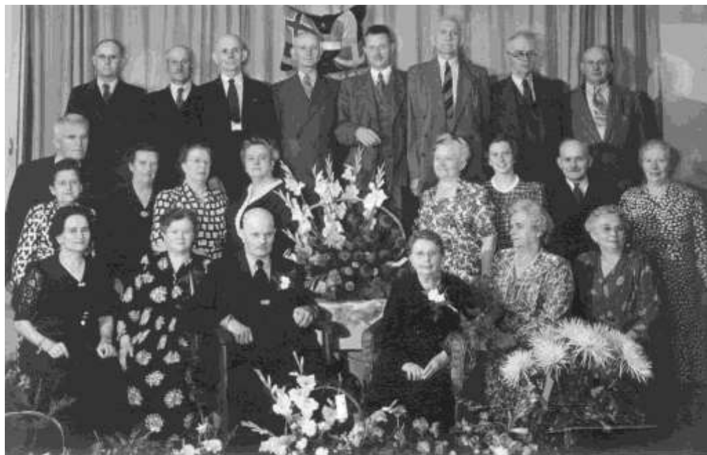
50 jarig huwelijk, in 1950

Bemoedigend voor alle komende generaties, dit beeld van saamhorigheid ondanks alle verschillen?