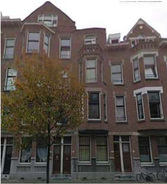
Adrien Mildersstraat 66a en b. Foto 2010, via Google Earth.

Op 17 januari 1905 staat zij ingeschreven in Rotterdam, wonend Adrien Mildersstraat 66a. Het heet dan dat zij zonder beroep is. In 1920 komt zij op dit adres weer terug. De huizen op de foto zijn van 1917, in 1955 grondig opgeknapt en verbeterd.