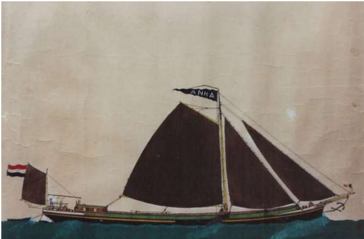
Sleepschip "Anna", omgebouwd tot zeilschip, tekening ingekleurd met plakkaatverf

Type: stalen klipper, gebouwd als sleepschip Laadvermogen: 335,9 ton Afmetingen: 39,6 X 6,59 m (L X B) (*) Gebouwd: 1901, gebouwd te Capelle aan de IJssel Bouwwaarde: 19000 Mark (Rheinschiffsregister; mark was 60 cent)